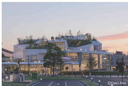
太田市美術館・図書館

1971年大阪府に生まれる。1997年京都大学大学院工学研究科修了。伊東豊雄建築設計事務所勤務の後、2005年平田晃久建築設計事務所を設立。現在、京都大学教授。主な作品に「樹屋本店」(2006)、「sarugaku」(2008)、「Bloomberg Pavilion」(2011)、「kotoriku」(2014)、「太田市美術館・図書館」「Tree-ness House」(2017)等。第19回JIA新人賞(2008)、第13回ベネチアビエンナーレ国際建築展金獅子賞(2012、伊東豊雄・畠山直哉・他2名との共働受賞)、LANCESSカラーコンクリートアワード(2015)、村野藤吾賞(2018)、BCS賞(2018)等多数受賞。著書に『Discovering New』(TOTO出版)、『JA108 Akihisa HIRATA 平田晃久 2017→2003』(新建築社)等。また、バウハウス(ドイツ)、ハーバード大学(アメリカ合衆国)、Architecture Foundation(イギリス)等で講演。そのほか、東京、ロンドン、ベルギーなどで個展、MoMAにて「Japanese Constellation」展(2016)を合同で開催。ミラノサローネ、アートバーゼル等にも多数出展している。