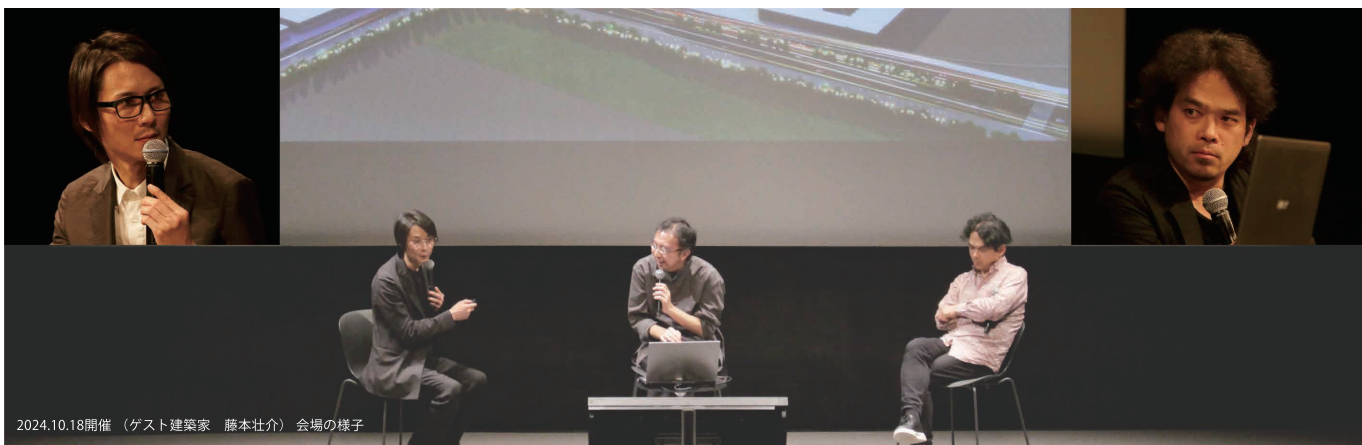
2024.10.18開催(ゲスト建築家 藤本壮介) 会場の様子