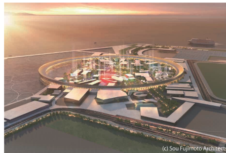
2025年日本国際博覧会