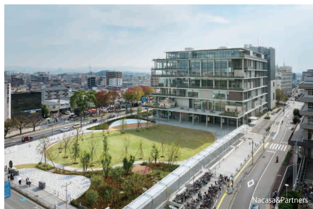
茨木市文化・子育て複合施設 おにクル

1941年生まれ。65年東京大学工学部建築学科卒業。主な作品に「シルバーハット」(東京)、「大館樹海ドーム」(秋田)、「せんだいメディアテーク」(宮城)、「まつもと市民芸術館」(長野)、「TOD'S 表参道ビル」(東京)、「多摩美術大学図書館(八王子)」(東京)、「座・高円寺」(東京)、「みんなの森 ぎふメディアコスモス」(岐阜)、「パロック・インターナショナルミュージアム・ブエラ」(メキシコ)、「台中国家歌劇院」(台湾)、「水戸市民会館」(茨城)、「茨木市文化・子育て複合施設 おにクル」(大阪)、「2025年日本国際博覧会大催事場」(大阪)など。現在、「国家児童未来館」(台湾)などが進行中。日本建築学会賞(作品賞、大賞)、ヴェネチア・ビエンナーレ金獅子賞、王立英国建築家協会(RIBA)ロイヤルゴールドメダル、朝日賞、高松宮殿下記念世界文化賞、ブリトカー建築賞、UIA ゴールドメダルなど受賞。2011年に私塾「伊東建築塾」を設立。これからのまちや建築を考える場として様々な活動を行っている。