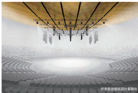
2025年日本国際博覧会 EXPO ホール