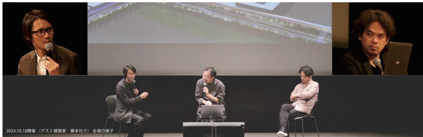
2024.10.18開催 (ゲスト建築家 藤本壮介) 会場の様子