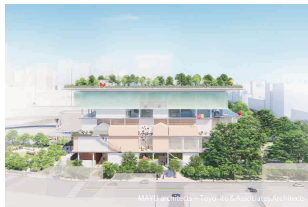
国家児童未来館 (台湾)