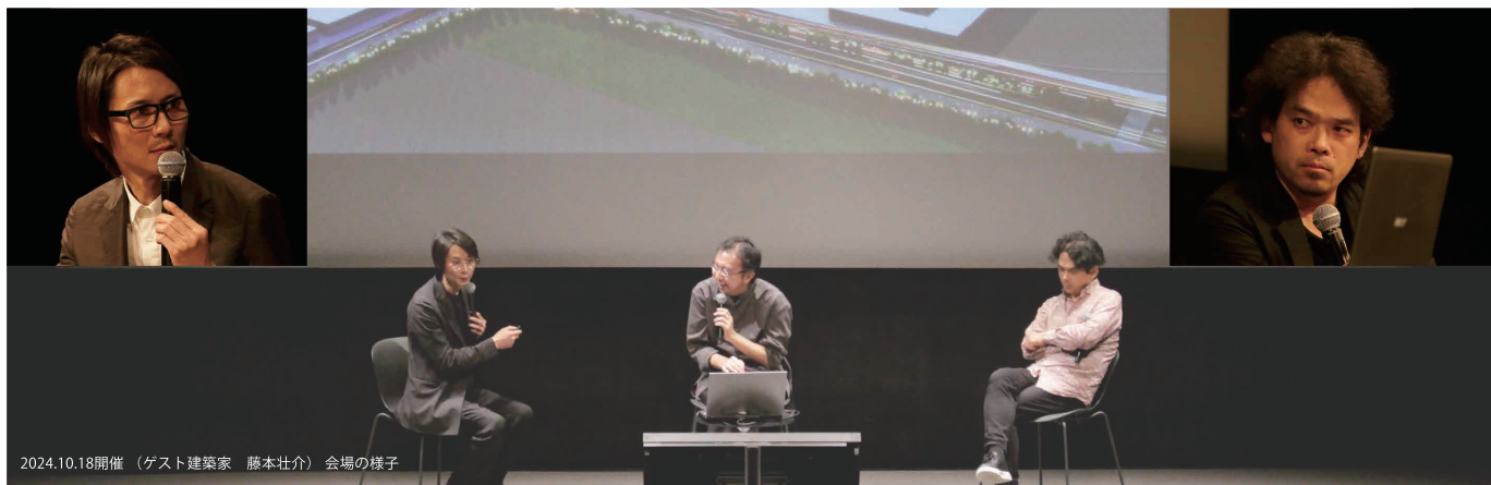
2024.10.18開催 (ゲスト建築家 藤本壮介) 会場の様子