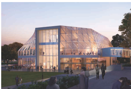
Buffalo AKG Art Museum