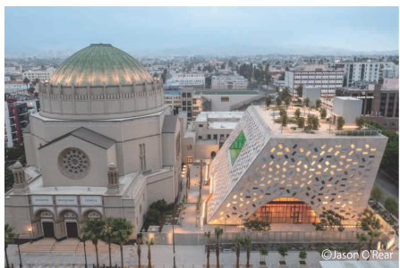
Audrey Irmas Pavilion

建築設計集団 OMA のパートナーおよびニューヨーク事務所代表。1973 年福岡県久留米市生まれ。九州大学工学部建築学科卒業後オランダに渡り、1998 年より国際建築設計集団 OMA に所属。2006 年ニューヨーク事務所代表に就任、2008 年よりパートナーとなる。主な作品はコーネル大学建築芸術学部新校舎、コーチ表参道フラッグシップストア、ケベック国立美術館新館、マイアミビーチの多目的アート施設ファエナ・フォーラム、メトロポリタン美術館コスチューム・インスティテュートの展覧会デザイン、オークションハウス・サザビーズ本社屋、ロサンゼルスウィルシャー・シナゴグの多目的イベント施設など。ニューヨークのニューミュージアム新館、パツファローのオルブライト・ノックス美術館の新館、東京の虎ノ門ヒルズステーションタワー、福岡の天神ビジネスセンターなど、世界各地で多岐にわたるプロジェクトが進行中。コーネル大学建築学部大学院、コロンビア大学大学院 GSAPP、ハーヴァード大学デザイン学部大学院 GSD などで客員教授を歴任し、2021 年より九州大学大学院人間環境学研究院教授、BeCAT (Built Environment Center with Art & Technology) センター長。