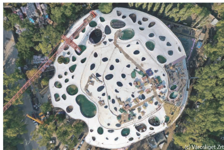
House of Hungarian Music