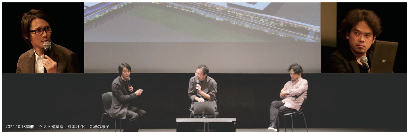
2024.10.18開催(ゲスト建築家 藤本壮介) 会場の様子