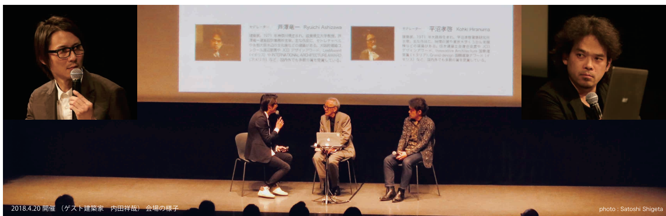
2018.4.20 開催 (ゲスト建築家 内田祥哉) 会場の様子