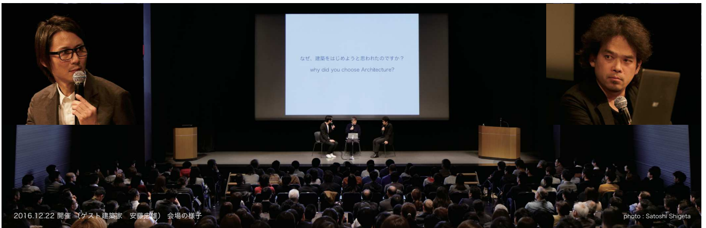
2016.12.22 開催(ゲスト建築家 安藤忠雄) 会場の様子