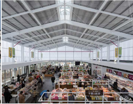
釜南町都市交流施設・道の駅 保田小学校