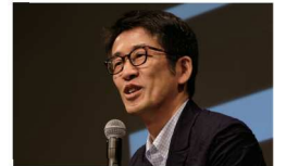
6.10 開催 ゲスト建築家 千葉学