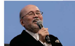
4.15 開催 ゲスト建築家 難波和彦