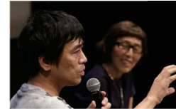
7.8 開催 ゲスト建築家 SANAA