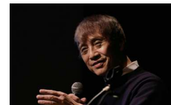
12.22 開催 ゲスト建築家 安藤忠雄