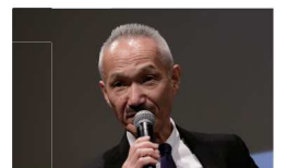
12.2 開催 ゲスト建築家 高松伸