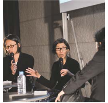
写真：2012 年度 開催の様子 (3.13・ゲスト建築家・妹島和世・開催時)